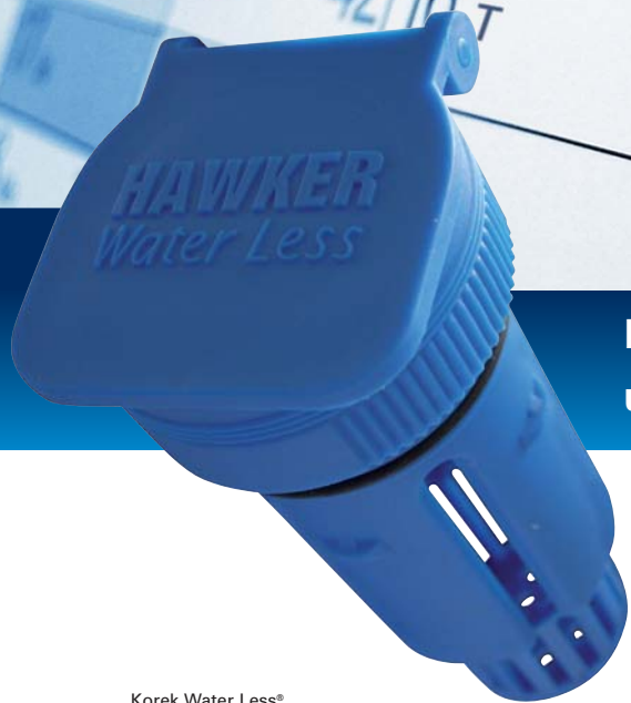
Korek Water Less®

Dłuższy czas użytkowania – Mniejsza częstotliwość uzupełniania poziomu elektrolitu